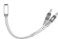
Adapter Kabel Audio 2in1