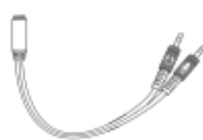
Adapter Kabel Audio 2in1