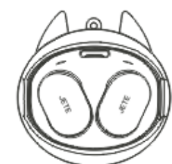
Kotak Pengisian Daya