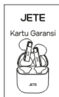
Panduan Penggunaan *1