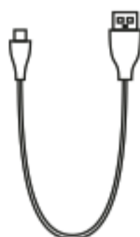
Kabel Pengisian Daya *1