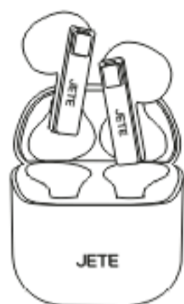
Kotak Pengisian Daya *1