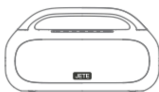
Speaker S8 PRO