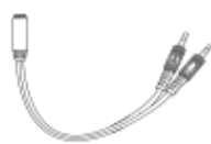
Adapter Kabel Audio 2in1