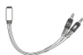
Adapter Kabel Audio 2in1